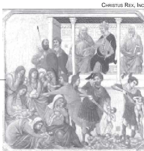
Duccio di Boninsegna: Viattomien teurastus. Museo dell'Opera del Duomo, Siena.