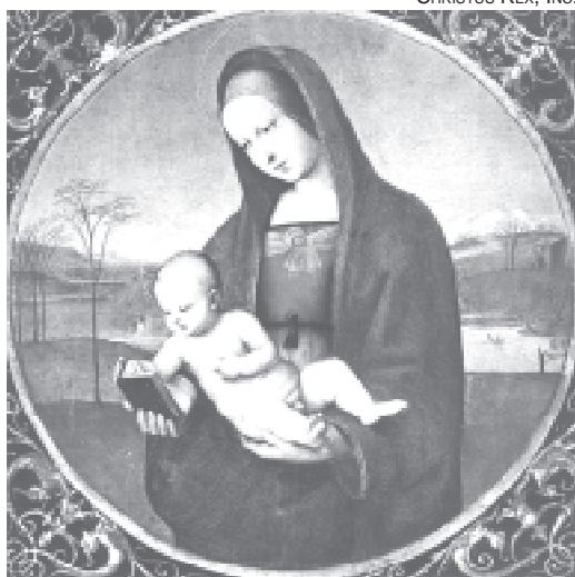
Raffaello Santi: Conestabile Madonna. Eremitaasi, Pietari.