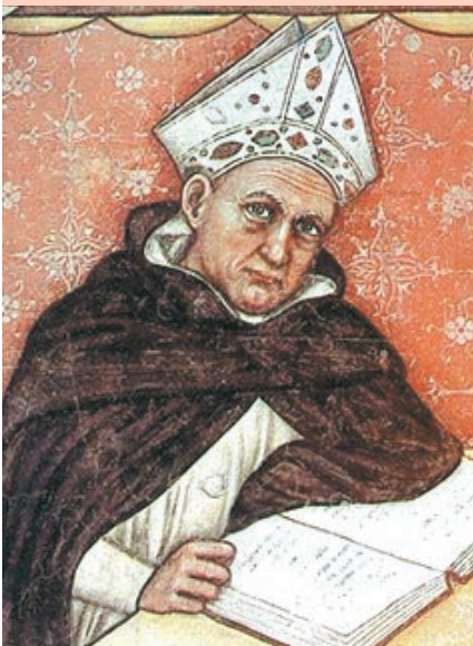
TOMMASO DA MODENA: PÄÄ: ALBERTUS MAGNUS OP

Uskonkappale vahvistaa tämän, ja itse kiirastulen olemassaolo kertoo, että osa rangaistuksestamme täytyy yhä maksaa, vaikka viat olisikin annettu anteeksi. Synti jättää jälkiä sieluun, joka täytyy puhdistaa, joko tässä elämässä tai kiirastuleessa. Kiirastuleessa aidosti katuvaisina kuolleiden sielut suorittavat loppuun hyvityksen niistä synneistä, joita ovat elämänsä aikana tehneet. Tosi rakkaus Jeesuskeeseen Kristukseen vaatii enemmän kuin vain uskon hänen anteeksianton sanaansa ja kiitollisuuden häntä kohtaan. Se johtaa meidät jakamaan hänen surunsa ja kärsimyksensä. Tarkoittaako sitten syntiemme hyvittäminen täällä maan päällä elämän muuttamista kidutuskammioiksi? Aivan päinvastoin. Elämämme maan päällä pitäisi olla ilon aikaa, jolloin saamme jo mais-