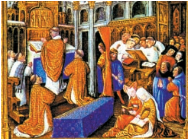
Joulumessu. Les Très Riches Heures du Duc de Berry. Folio 158r.