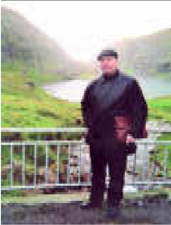
Allekirjoittanut tutustumassa Färssaarten uljaaseen luontoon.

kouksissanne”, sisaret pyytävät kauttani suomalaisilta.