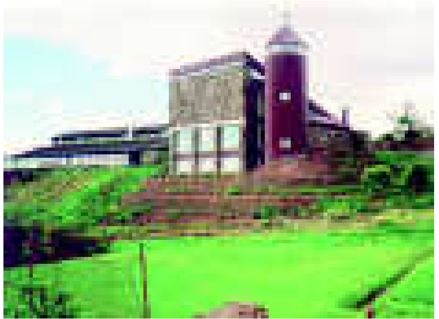
Pyhän Marian kirkko, Mariukirkjan, Torshavnissa.

Fransiskaanisiet ovat totisesti kotiutuneet luon-