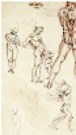
Leonardo da Vinci: Anatominen harjoitelma.