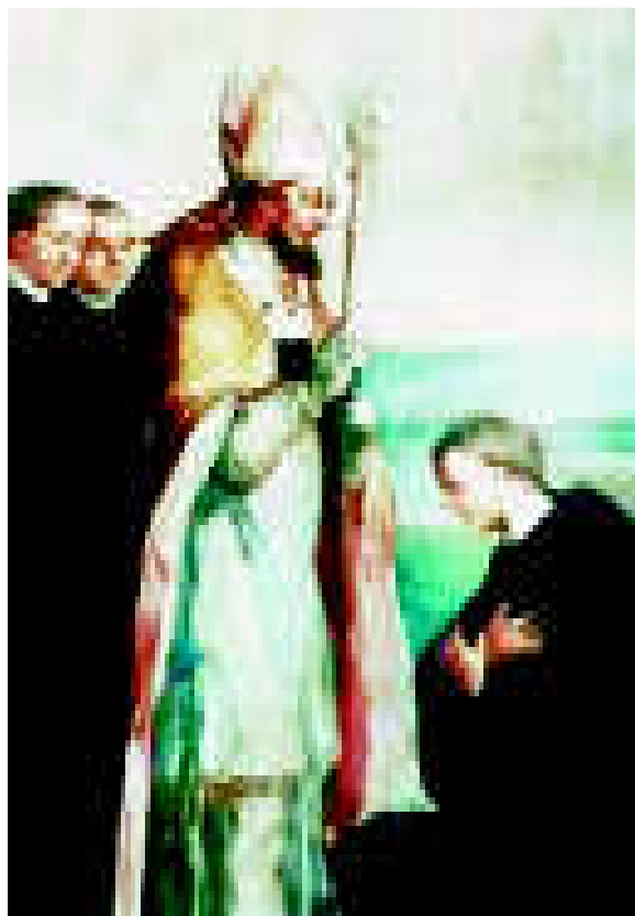
Den helige Bonifatius och den helige Sturmi(us).

Den helige Sturmi föddes i Bayern i en kristen familj. Redan som barn gavs han av sina föräldrar i St. Bonifatius vård. Denne lämnade hans uppfostran åt den helige Wigbert i klostret Fritzlar. Där växte han upp och blev i sinom tid prästvigd. Och utgående från klostret missionerade han sedan under tre år i Westfalien. Men han längtade efter eremit- eller klosterliv och efter dessa tre år fick han tillåtelse att med två medbröder starta en eremitboning. Det gjorde de i skogen nära Hersfeld. Men denna trakt låg för nära de saxiska områdena och riskerade att bli utsatt för saxiska anfall. St. Bonifatius hittade ett bättre område något sydligare. Där kunde man bygga ett kloster, som var mera skyddat men från vilket man ändå kunde missionera saxarna. Sturmi besteg genast klostrets åsna och begav sig personligen för att söka ett gott ställe. Han valde den plats där floderna Greizbach och Fulda förenades sig. År 744 grundades klostret Fulda som blev den foundation som Bonifatius älskade allra mest. Han utnämnde Sturmi till klostrets första abbot. Bonifatius önskade att det skulle bli kloster-