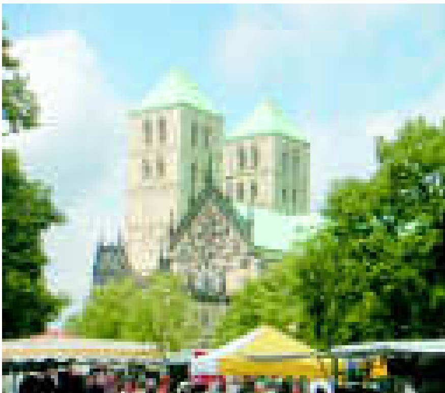
Katedralkyrkan i Münster.