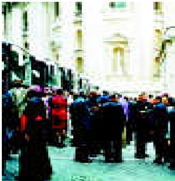
Åtta bussar behövdes när alla drygt 300 delegater skulle föras till Vatikanen för audiens. Det var den enda dagen man kunde skilja biskopar och kardinaler från vanliga präster och lekmän.

"Kära bröder och systrar! Kyrkans sociallära kallar framför allt er, kristna lekmän, att leva i samhället som 'Kristi vittnen' och öppna er för den medmänskliga kärlekens horisont. Vi är nu inne i den kristna kärlekens tid, och det gäller också social och politisk kärlek till nästan; det är en kraft som med evangeliets nåd kan ge liv åt arbete, ekonomi och politik, och bygga vägar av fred, rättvisa och vänskap mellan folken," sade påven. "Det är nu dags för en förny-