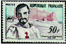
Den franska posten har publicerat ett frimärke om Charles de Foucauld.

Men kallet från öknen blev bara starkare. Då återvände han till Frankrike för att studera till präst. När han blivit vigd för han till Algeriet, då en fransk koloni, och byggde åt sig en stuga i oasen Beni-Abbes i hopp om att därifrån