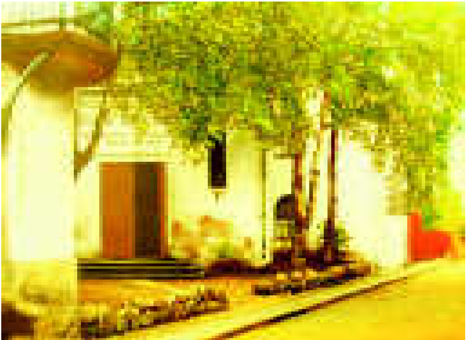
Viipurin Pyhän Hyacintuksen kirkko.