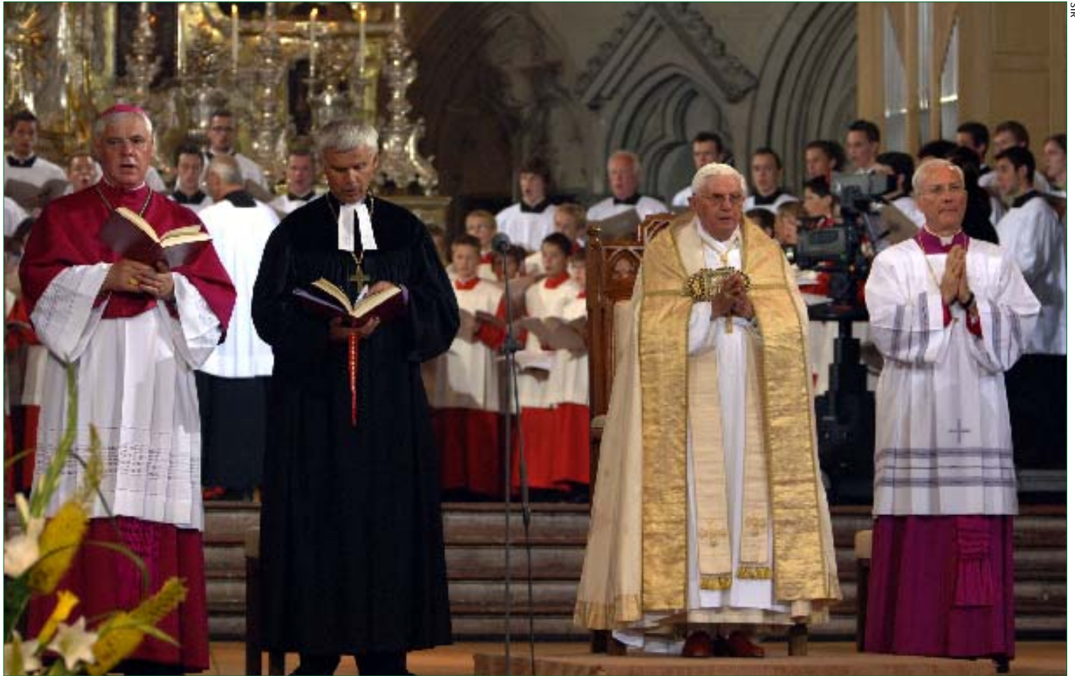
Kristittyjen ykseyden edistäminen on yksi paavi Benedictuksen tärkeimmistä tavoitteista. Yllä kuva ekumeenisesta rukouhetkestä Baijerin vierailulta.

nimenomaan kirkon ykseyttä palveleva virka. Jos otetaan huomioon nykytilanne, kaikkien kristittyjen ykseys on jo osittain taattu, koska katoliset kristityt ovat jo yhdessä. "Ei tarvitse aloittaa nollassa." Kaikki nämä toteamukset katsovat kirkkoa kokonaisuutena, jossa hallitsevat hengelliset siteet (usko, toivo, rakkaus) ja näkyvissä olevat siteet (uskontunnustus, sakramentit, apostolinen palveluvirka).