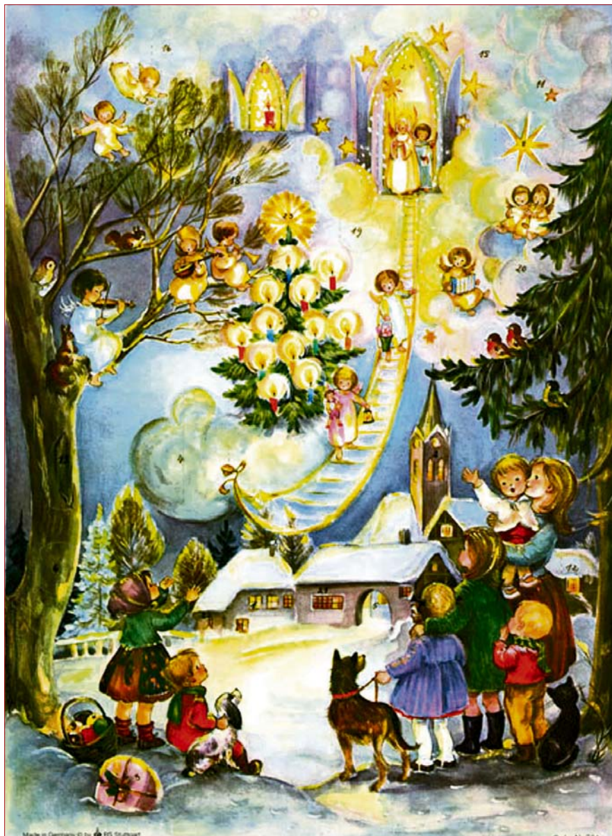
Joulukalentereiden kuva-aiheet eivät rajoitu yksin Jeesuksen syntymään. Kuvassa Suomen Caritasin myymä saksalainen joulukalenteri.

"Varhaisina aikoina uskonnollisissa perheissä ripustettiin seinälle kuvia, yksi jokaista joulukuun päivää varten."