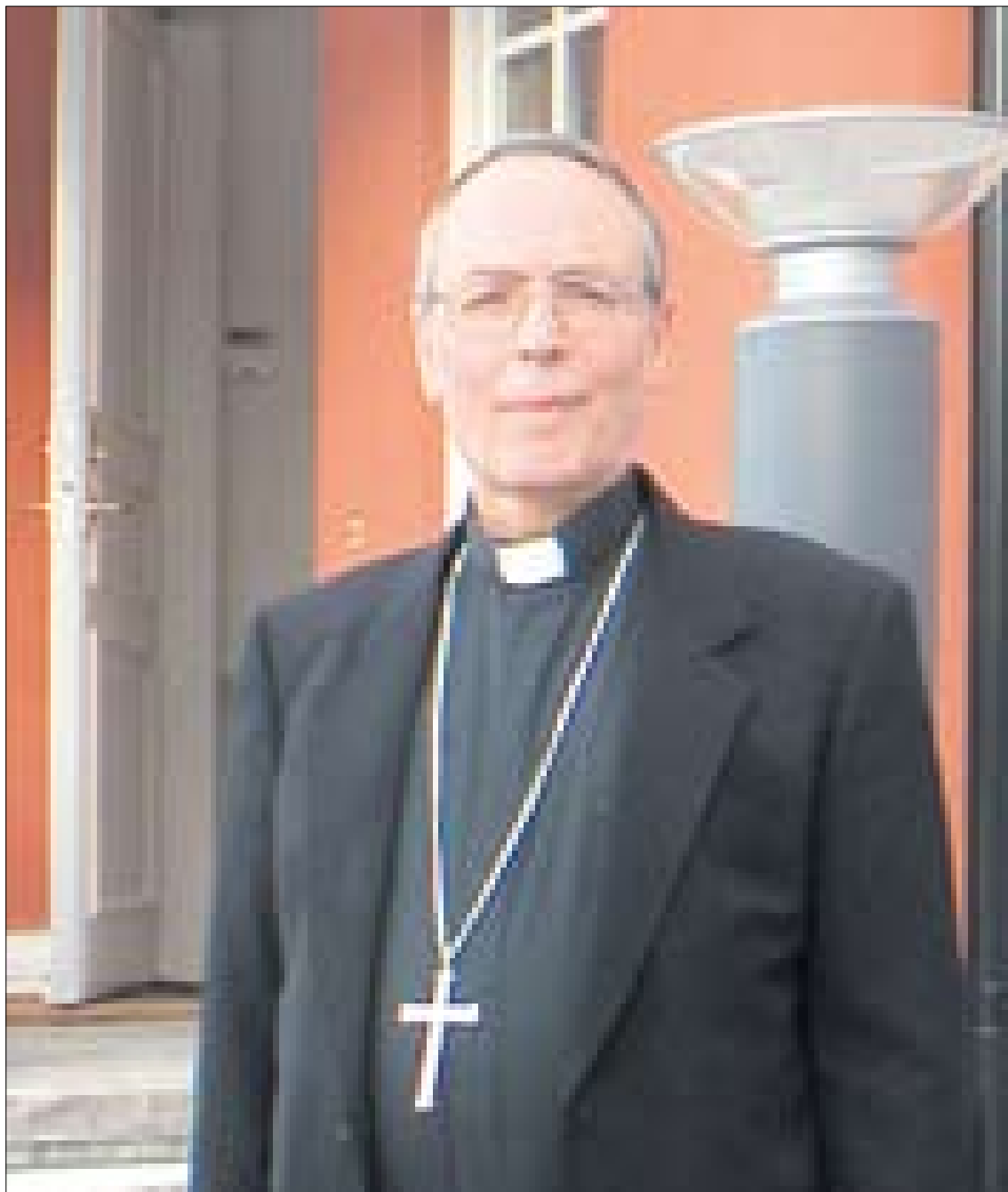
Arkkipiispa Biggion sielun puolesta rukoiltiin erityisesti messussa Pyhän Henrikin katedraalissa 25.4.

“Eläköön hän yhdessä Kristuksen, rakastamansa Hyvän Paimenen, kanssa, jonka luokse hänet on kutsuttu ylösnou- semusaikana” (nuntiuksen kuolemasta kertovasta uutises- ta). — Requiescat in pace!