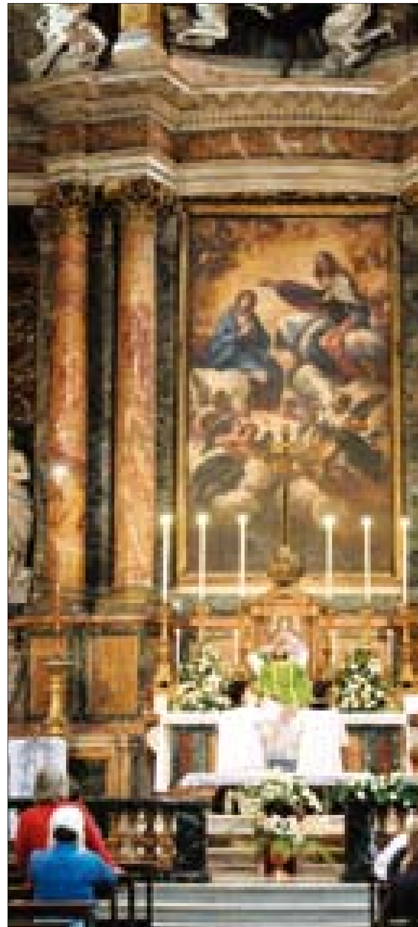
Piispan luvalla vanhamuotoista liturgiaa on saanut viettää tähänkin asti. Kuva Rooman keskustan Gesú e Maria -kirkosta.

1. Paavali VI:n julkaisema Missale Romanum on katolisen kirkon latinalaisen riituksen "rukouksen säännön ( lex orandi )" tavallinen ilmaisumuoto. Toisaalta pyhän Pius V:n julkaisemaa ja autuaan Johannes XXIII:n toimituttamaa Missale Romanumia on pidettävä kirkon saman "rukouksen lain ( lex orandi )" erityisenä ilmaisumuotona. Sen kunnioitettavan ja vanhan käytön takia sille kuuluu osoittaa asianmukaista arvostusta. Nämä kaksi kirkon "rukouksen säännön ( lex orandi )" ilmaisumuotoa eivät mitenkään johda "uskon säännön