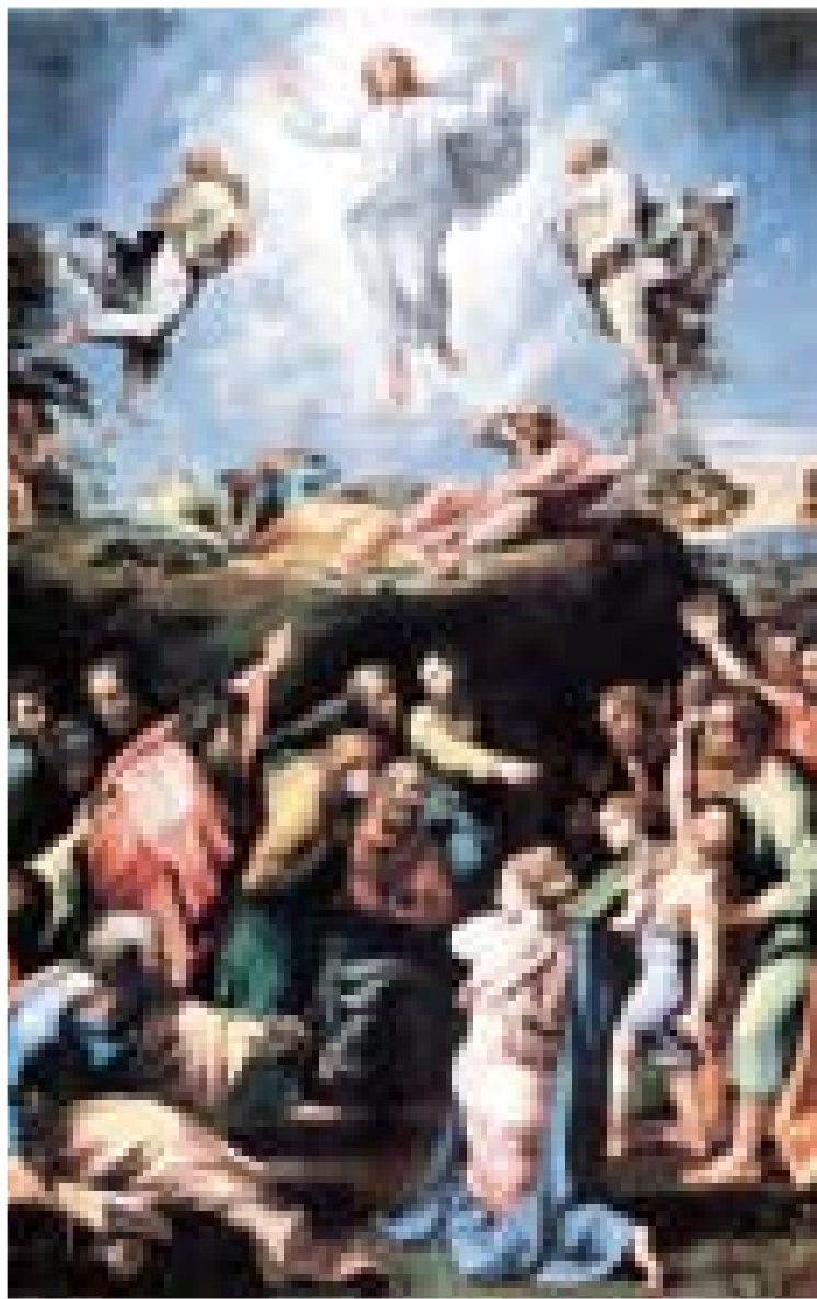
Raffaello: Herran kirkastuminen

O i Maria, hellyyden lähde, auta minua kärsimykseni tuskissa. E4