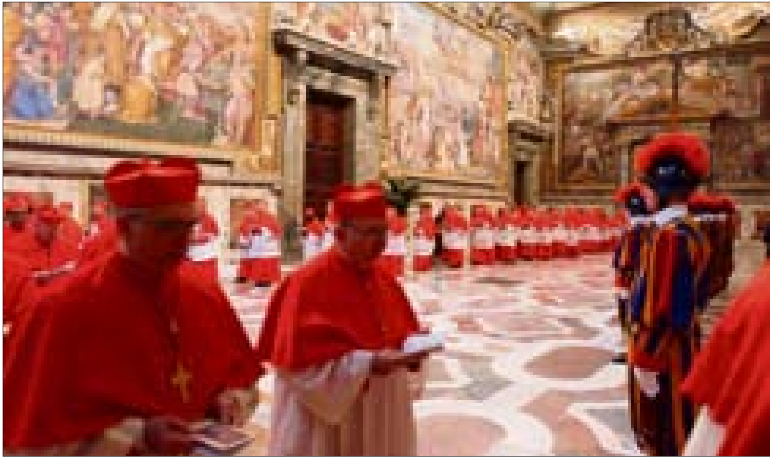
Kardinaalit matkalla konklaaviin paavi Johannes Paavali II:n kuoltua huhtikuussa 2005.