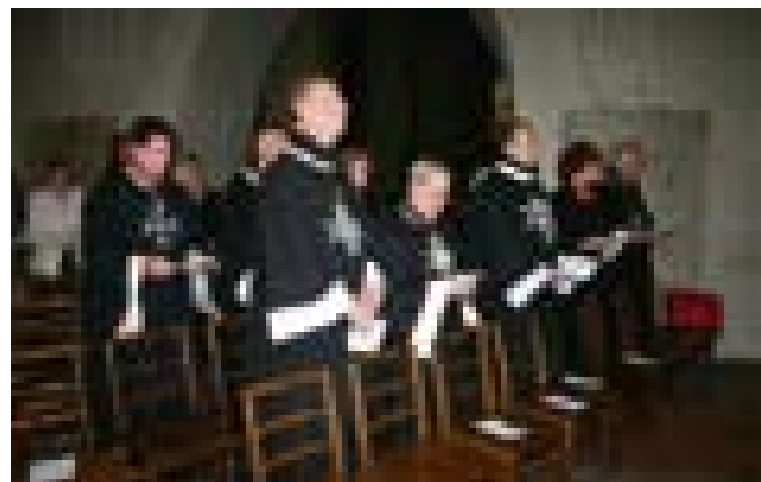
Ritarikunnan jäsenet koolla Turun tuomiokirkossa.