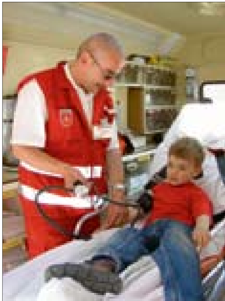
Ritarikunnan lääkärit hoitavat sairaita lapsia

Fides julkaisi numerossa 9/2007 artikkelini "Skandinavian Maltan ritarit koontuivat Islannissa". Koska kirjoitukseni on herättänyt mielenkiintoista keskustelua Suomen katolilaisten parissa ja koska olen saanut eri tahoilta palautetta siitä, pyydän Fideksen toimitukselta mahdollisuutta selventää vielä muutamia sen sisältämiä yksityiskohtia.