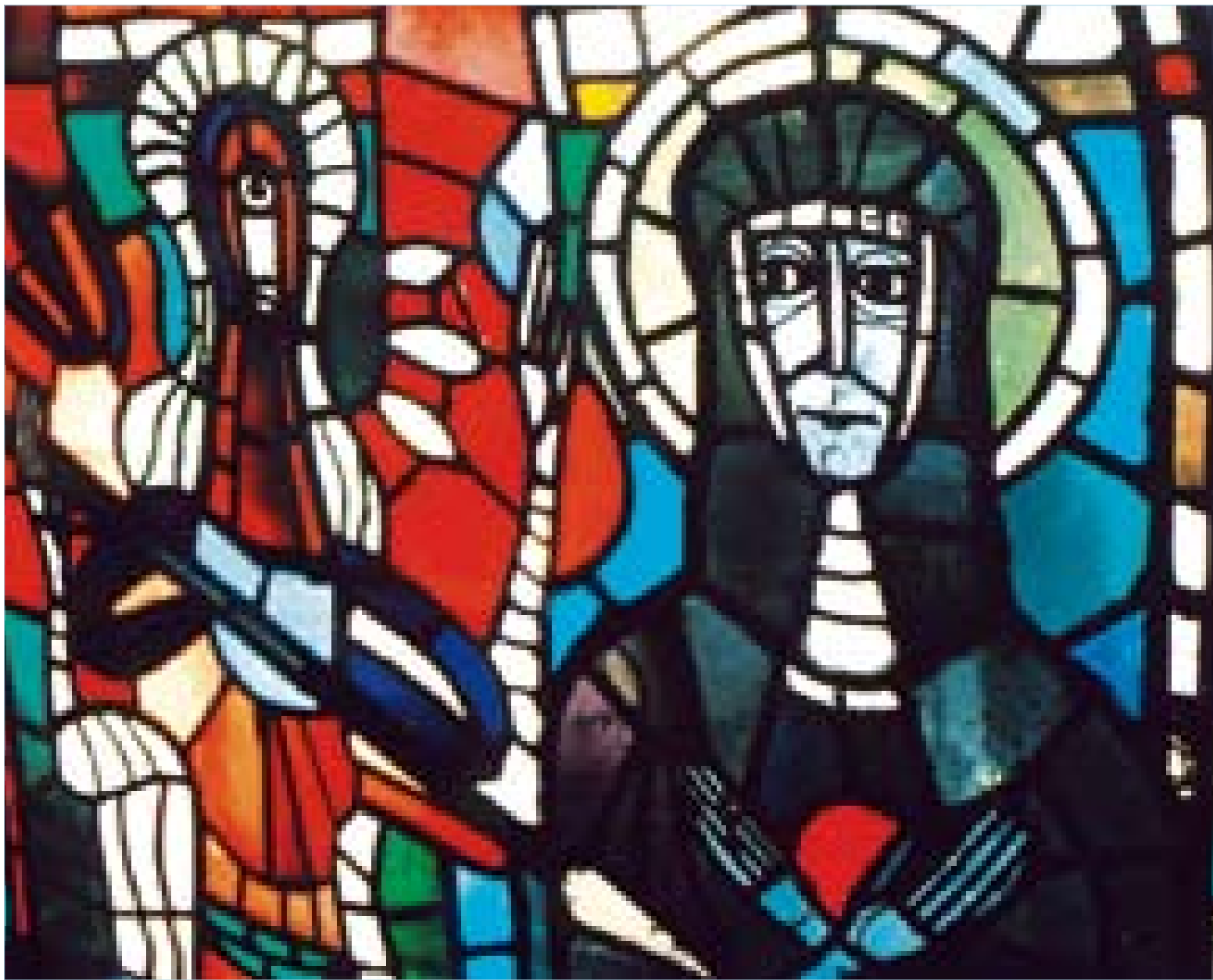
Pyhän Jeesuksen Teresan, neitsyen ja kirkonopettajan muistopäivää vietetään 15.10. Kuvassa: Pyhän Henrikin katedraalin lasimaalaus.