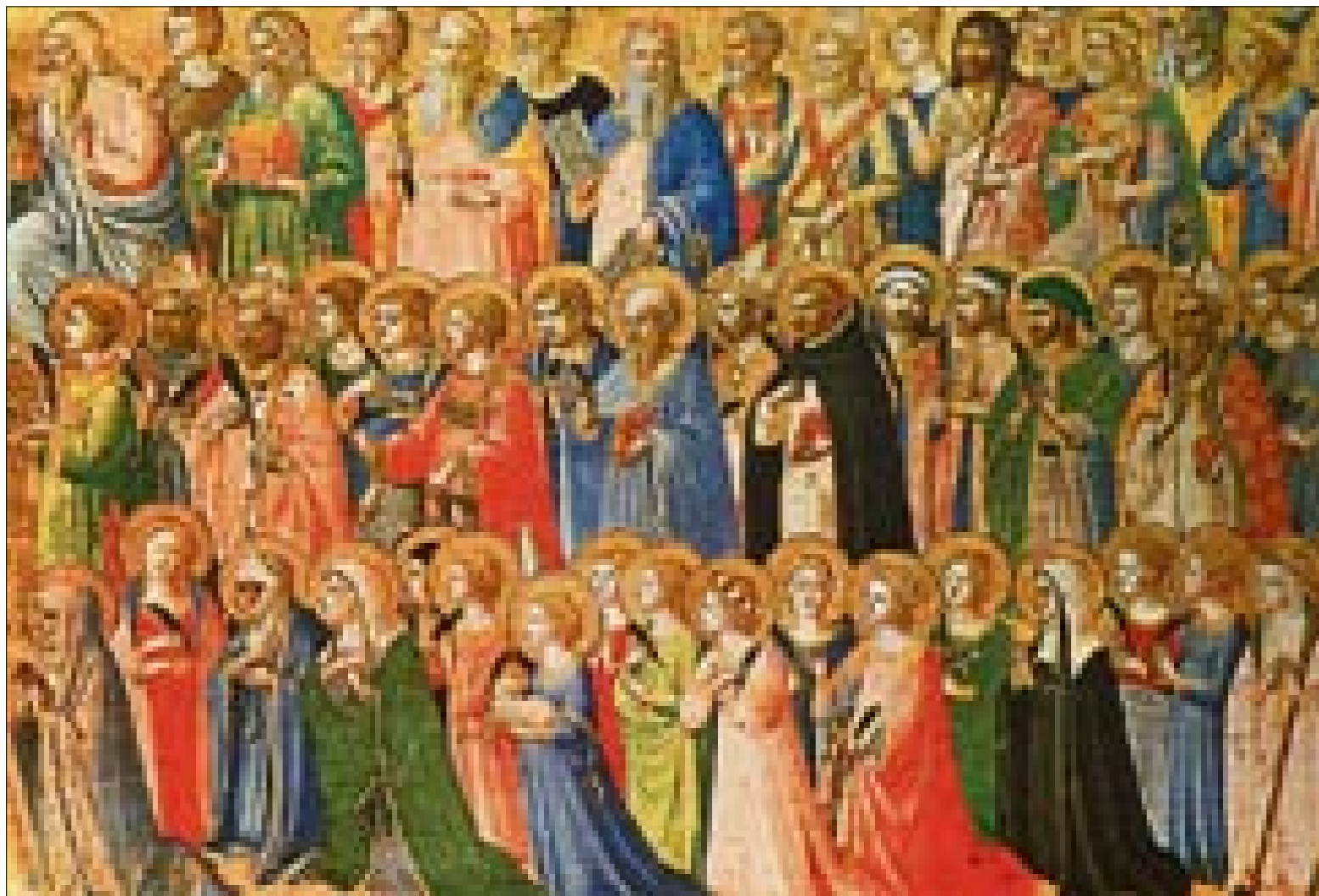
Kaikkien pyhien juhlaa vietetään tänä vuonna sunnuntaina 4.11. Kuva: Fra Angelico.